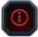
Tabela de plăți

Dați clic pentru a vizualiza regulile jocului.