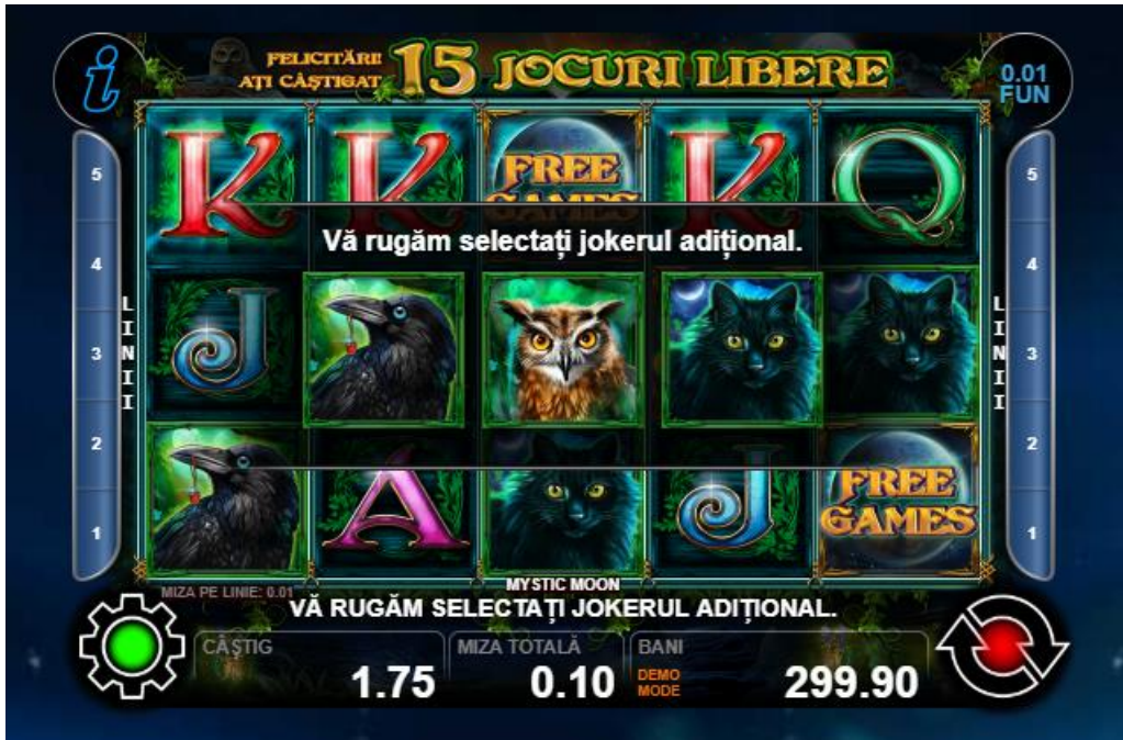
Fig.3 Selectarea unui simbol suplimentar de înlocuire în jocurile gratuite

Simbolurile suplimentare de înlocuire înlocuiesc toate celelalte simboluri, cu excepția simbolului "Mystic Moon".