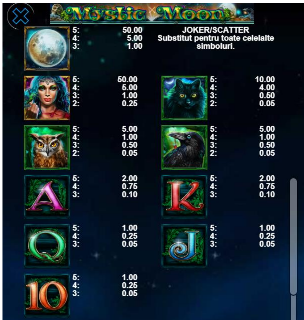
Fig.2 Tabelul câștigurilor