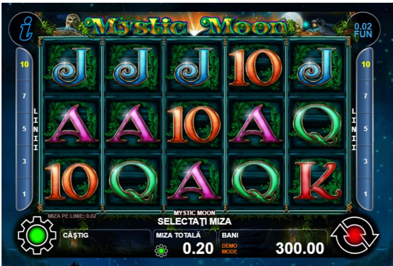
Fig. 1 Ecran al jocului principal