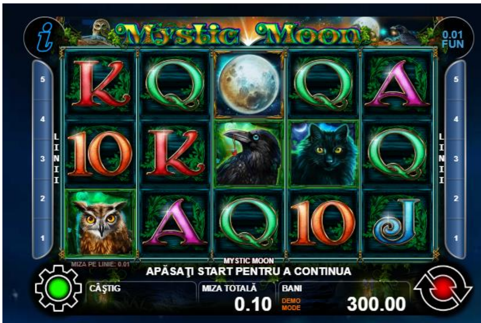
Fig.4 Ecran joc gratuit