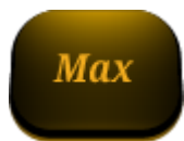
Butonul Pariu Max

fereastra de dialog de joc automat avansat